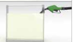
Kevesebb hab képződik tankoláskor