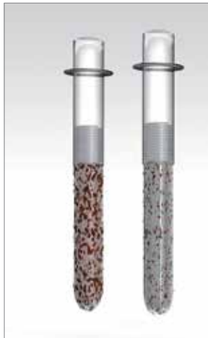
A felszínen korrózió alakul ki