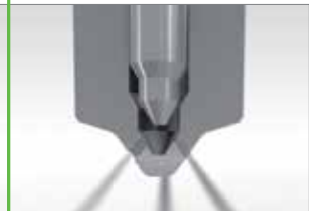
Nem képződnek lerakódások