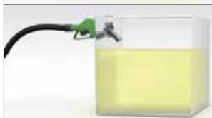
Hab képződik tankoláskor