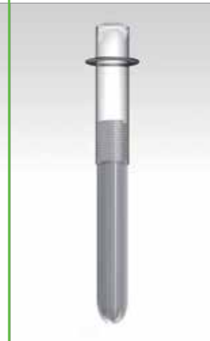
A felszínen nem alakul ki korrózió